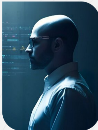
الگوی مهاجرت دانشمندان در جهان